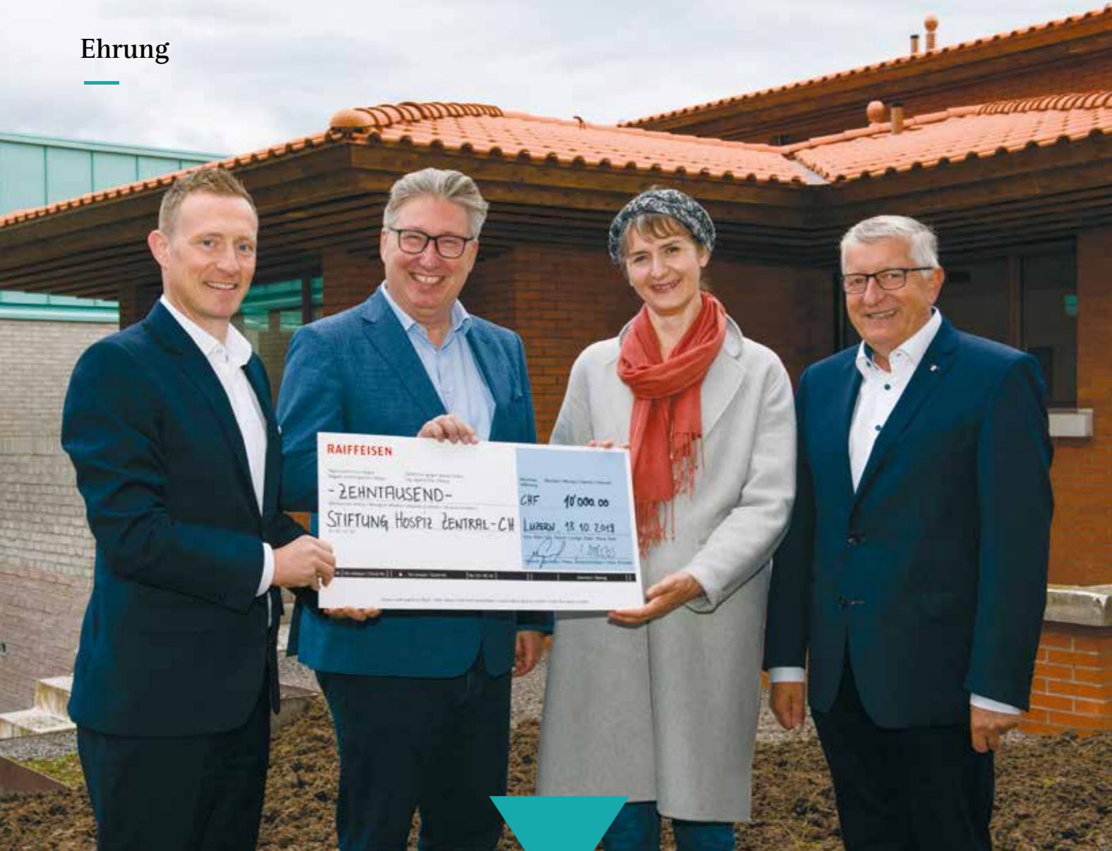
Raiffeisen überreicht 1. Anerkennungspreis