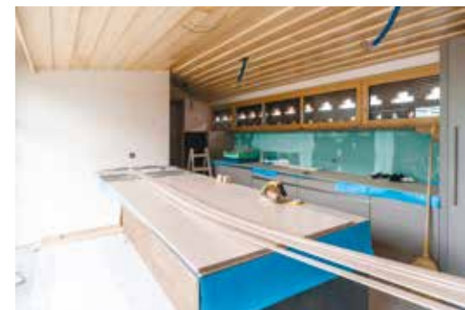
Die Küche im März, September und Oktober 2019